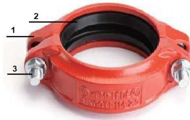
Рис.2. Гибкая муфта «LEDE».