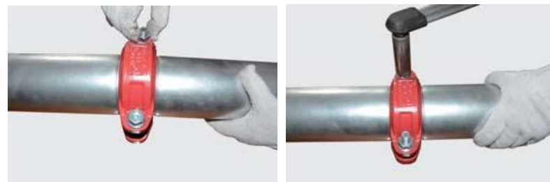
Рис.3. Грувлочное соединение гибкой муфтой.